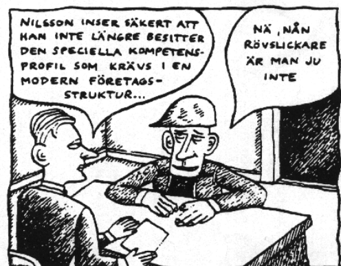
Illustration: Robert Nyberg

Seko Klubb Lokförarna kan inte acceptera det sätt som Euromaint behandlar sin personal och kommer att bevaka och i alla lägen där det är möjligt trycka på för att EM Stockholmståg (Älvsjö och Bro) inte agerar på liknande sätt. Ytterst handlar det om vilka krav vi från Stockholmståg ställer på våra underentreprenörer, därför har vi också möjlighet att påverka.